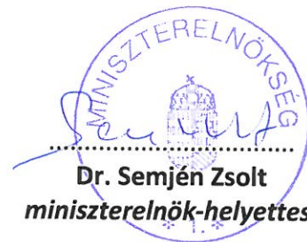
Dr. Semjén Zsolt miniszterelnök-helyettes