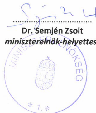
Dr. Semjén Zsolt miniszterelnök-helyettes