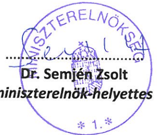
Dr. Semjén Zsolt miniszterelnök-helyettes